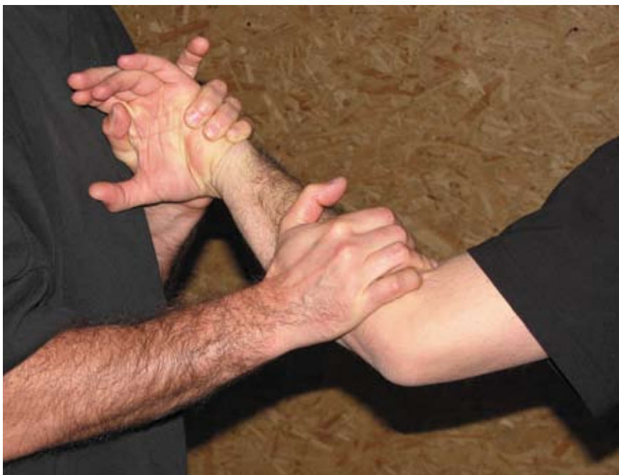
Fot 21 Dźwignia na nadgarstek z uchwytu odwrotnego z kontrolą łokcia