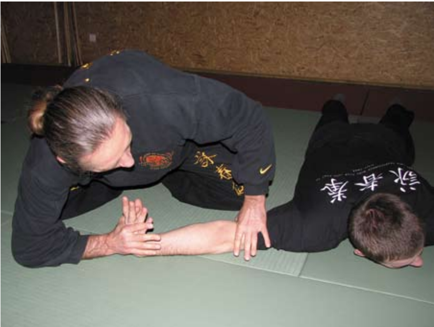
Fot 15 Dźwignia na nadgarstek w parterze