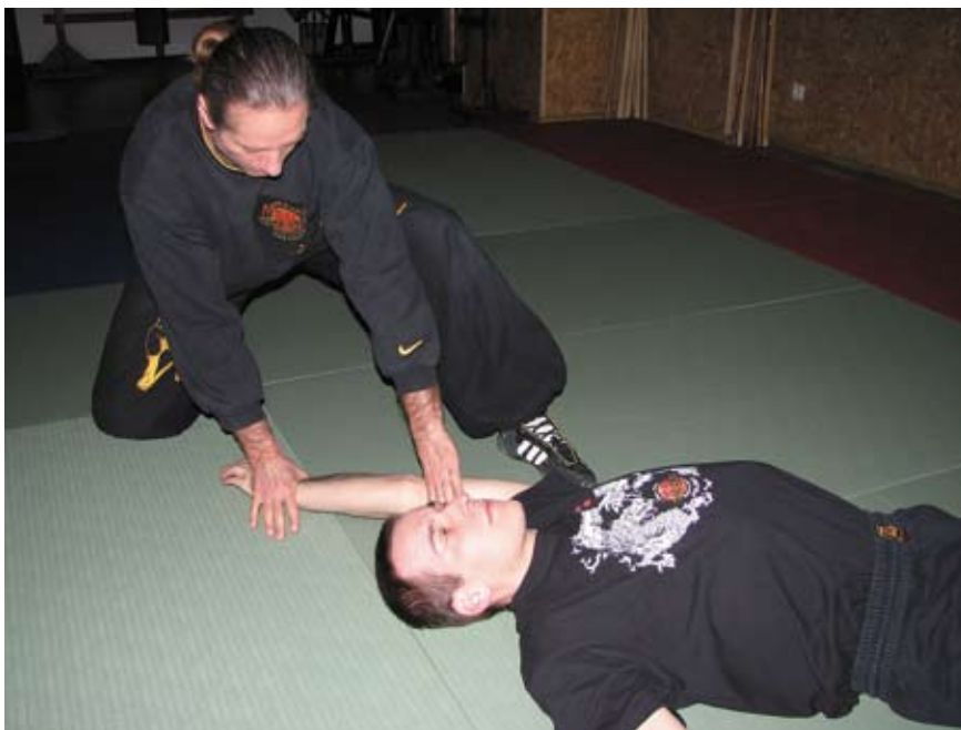
Fot. 3 Dźwignia na staw łokciowy w parterze