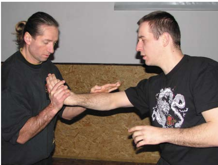
Fot 20 Dźwignia na nadgarstek z uchwytu odwrotnego z kontrolą łokcia