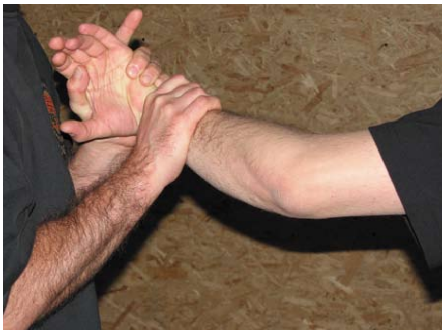
Fot 19 Dźwignia na nadgarstek z uchwytu odwrotnego