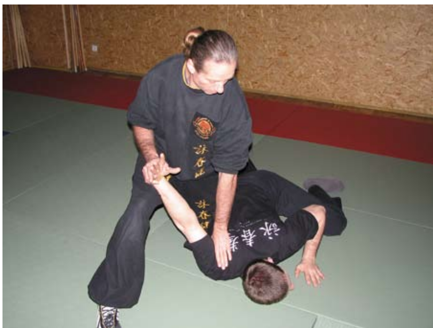
Fot. 6 Kontrola ciała przeciwnika w parterze poprzez przytrzymanie barku i biodra