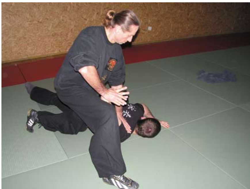
Fot. 7 Dźwignia na staw barkowy