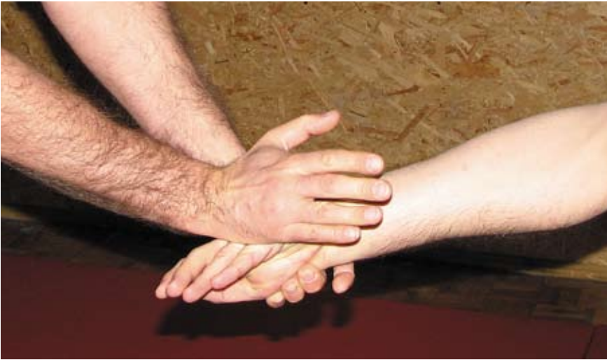
Fot. 17 Uchwyt równoległy na nadgarstek z kontrolą drugiej ręki

Aby nauczyć się odpowiedniej reakcji na atak agresora niezbędne dla uczestników jest nieustanne ćwiczenie zmysłu dotyku. Wytrenowana osoba jest w stanie po dotknięciu pewnego fragmentu ciała partnera, z którym stykają się jego kończyny, rozpoznać ułożenie całej sylwetki. Posiadając takie umiejętności trenujący może, przy pomocy odpowiedniego sposobu poruszania się i wykonywania ruchów kończyn, kontrolować kierunki siły przeciwnika.