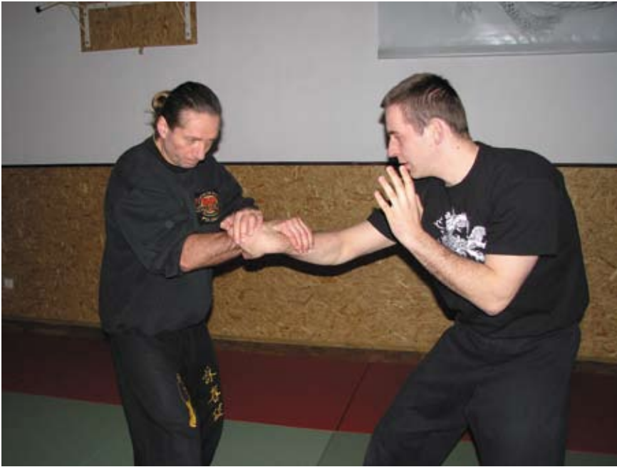
Fot. 8 Dźwignia na nadgarstek z uchwytu skrzyżnego