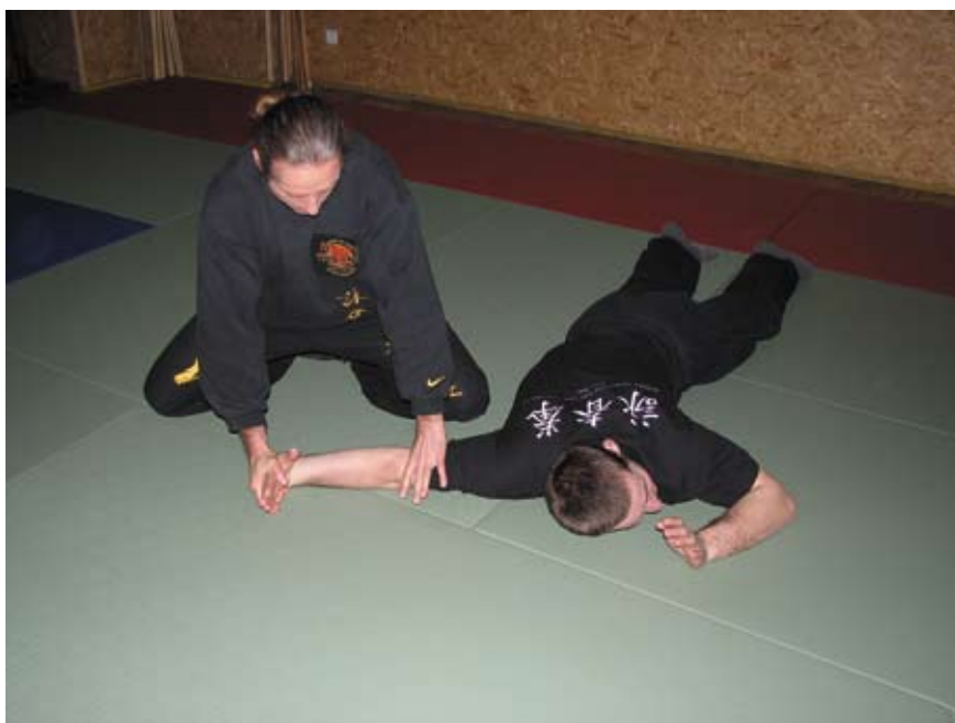
Fot 12 Dźwignia na nadgarstek w parterze