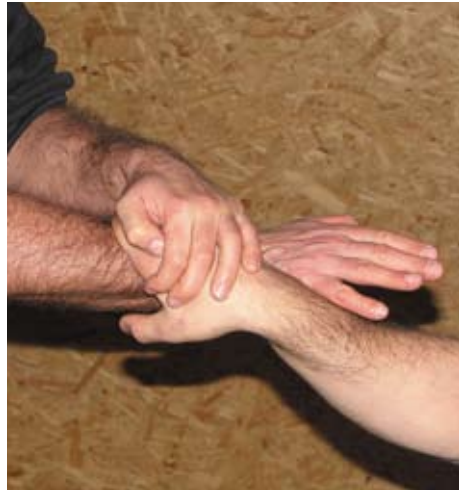
Fot. 9,10 Dźwignia na nadgarstek z uchwytu skrzyżnego

z których jedna dba o odpowiednią dynamikę treningu, tłumaczenie części technicznej zajęć, opracowanie i realizowanie konspektu zajęć, a także o właściwe następstwo nauczanych technik, druga osoba natomiast (asystent) stale koryguje wymagających tego uczestników.