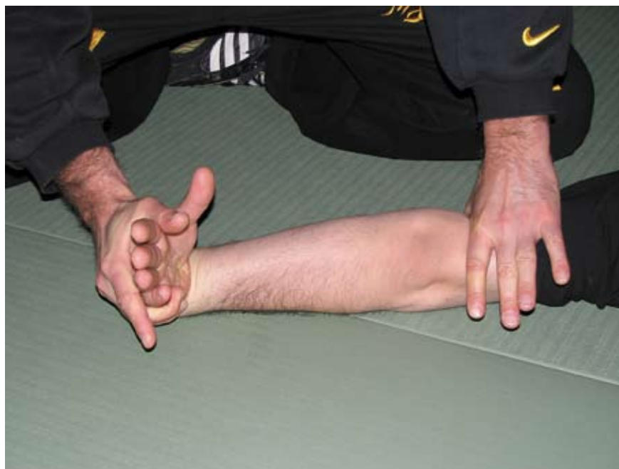
Fot 13 Dźwignia na nadgarstek w parterze