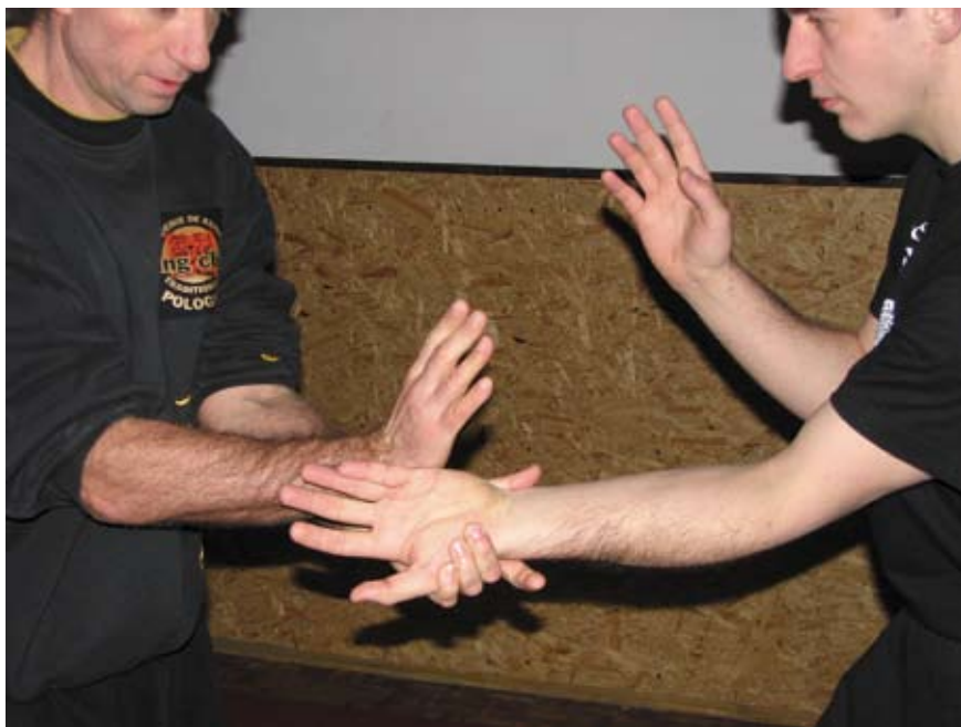
Fot. 16 Uchwyt równoległy na nadgarstek z kontrolą drugiej ręki

Trening wymaga też od uczestników poprawienia koordynacji ruchowej. W tym celu należy stworzyć ćwiczenia przystosowane do założeń systemu. Doskonały do uzyskania tego efektu jest na przykład trening „zasłon”, podczas którego praktykujący na komendę instruktora wykonuje rękami ruchy na przemian chroniące dolną lub górną część jego ciała.