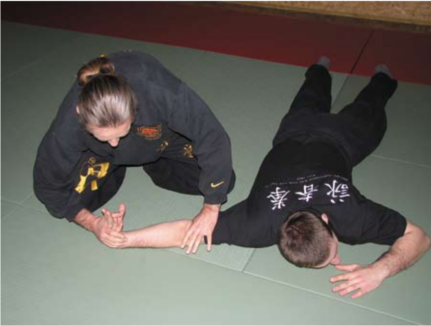
Fot 14 Dźwignia na nadgarstek w parterze