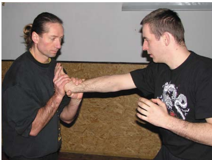
Fot 18 Dźwignia na nadgarstek z uchwytu odwrotnego