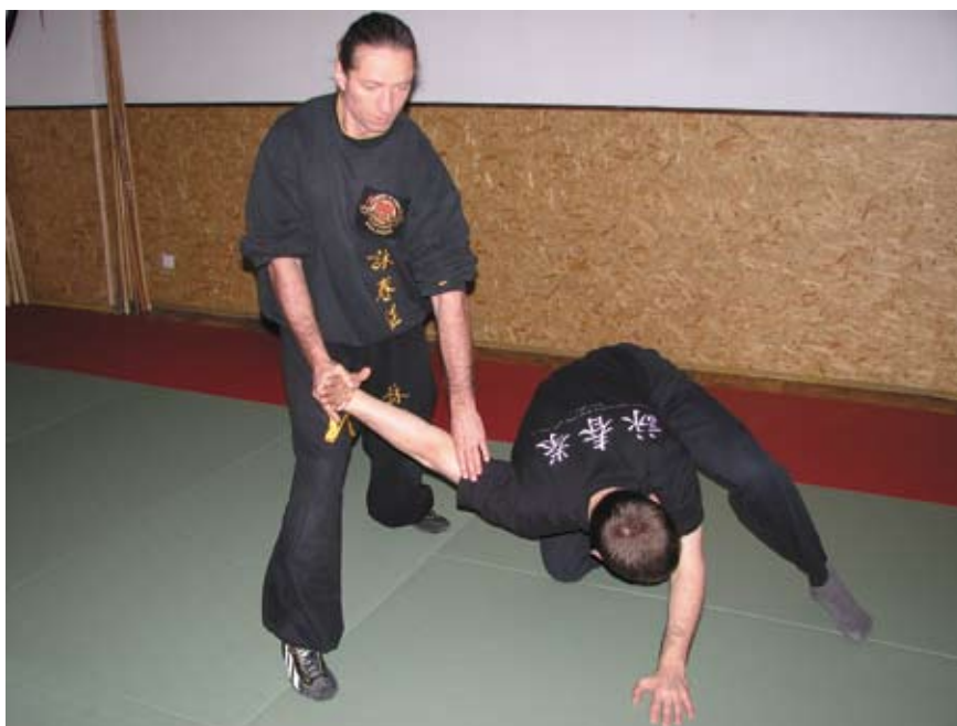
Fot. 5 Sprowadzenie do parteru z kontrolą nadgarstka i łokcia