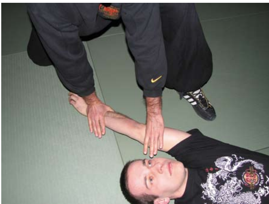
Fot. 2 Dźwignia na bark w parterze