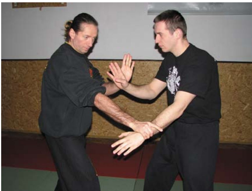
Fot. 11 Uchwyt równoległy na nadgarstek z kontrolą drugiej ręki

Tworząc system nauczania elementów wschodnich sztuk walki przystosowany do potrzeb osób niewidomych i słabowidzących, należy przede wszystkim wyeliminować z niego techniki, których osoby z dysfunkcją wzroku nie są w stanie skutecznie wykonać – a więc prowadzenia walki w długim dystansie – niewidomy na pewno nie może ani kopnąć, ani uderzyć napastnika.