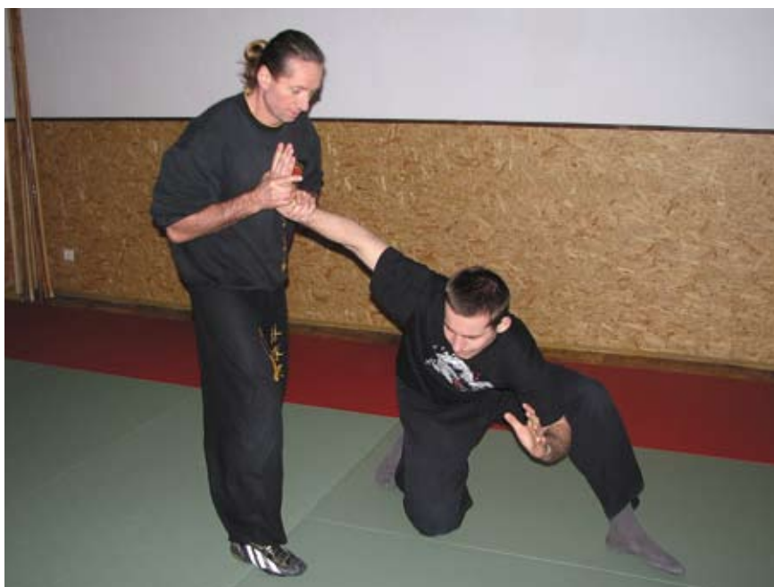
Fot. 4 Dźwignia na nadgarstek z uchwytu od spodu